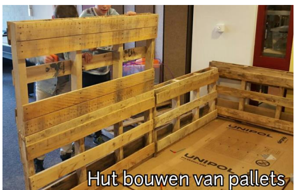
Hut bouwen van pallets