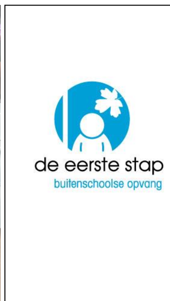
de eerste stap buitenschoolse opvang