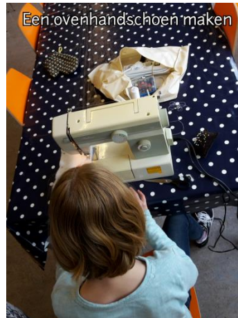
Een overhandschoen maken