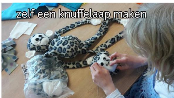
zelf een knuffelaap maken