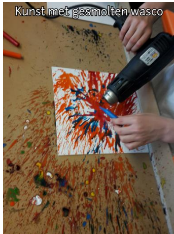
Kunst met gesmolten wasco